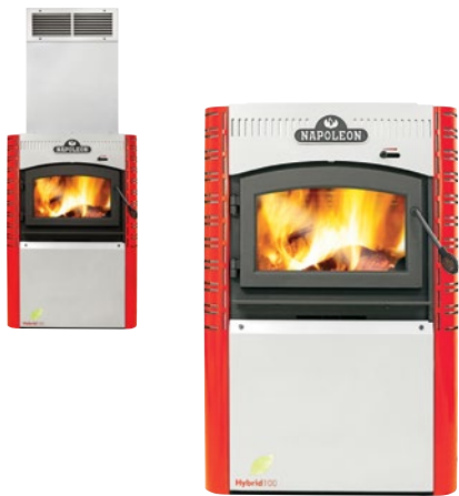
FABRIQUÉE AU CANADA